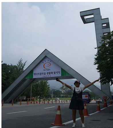
圖 2 本系大學部學生蕭惟芳赴海外交換學生時留影

本系對於學生赴姊妹校學習亦積極鼓勵，近年有蕭惟芳同學赴韓國慶南大學；鄭晴方、林振皓同學赴日本青山學院；何冠穎、黃怡瑩、高盈婷、羅媛蔚、曾意婷同學赴復旦大學；王靖嵐、呂偉頌、游偉萱、何姿儀、黃惠琪及白鴻毅同學赴廈門大學；林郁臻同學赴捷克查爾斯大學；翁浩原同學赴波蘭華沙大學；蔡雨耘、吳東頤同學赴山東大學；陳雲綺、康議文、張瑜珊、李洛竹同學赴吉林大學；劉哲宇、高萱容同學赴南京大學；林筠珍同學赴美國西佛羅里達大學。