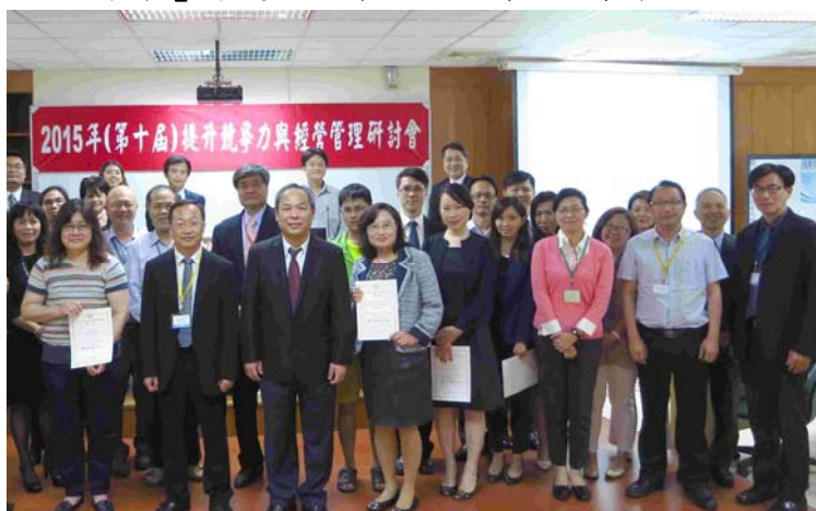
2015 年本系舉辦兩岸企業管理學術研討會