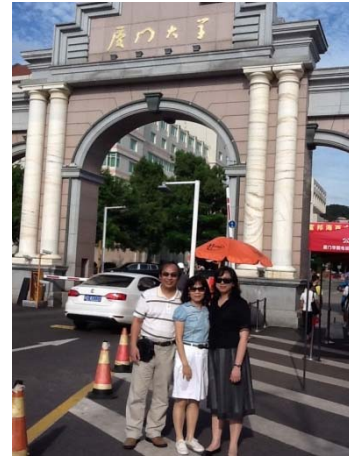
圖 10 本系教師於 100 學年度(2012/7/25) 赴廈門大學企管系學術交流時留影

除此之外，於 96 學年度管理學院開始了與北京中科院研究生學院之交換學習方案，本系計有 5 位研究生於 97 年 7 月赴北京學習近 3 週(北京中科院研有 13 位究生於 6 月底來本校學習)，97 學年度北京中科院有 16 位研究生於 6 月底來本校學習，本系因新流感因素並未有學生赴大陸研習，98 學年度本系計有 16 位碩專班研究生於 99 年 7 月赴北京學習近 3 週(北京中科院有 18 位研究生於 6 月底來本校學習)，99 學年度本系計有 20 位碩專班研究生於 99 年 6 月赴北京學習(北京中科院有 15 位研究生於 7 月初來本校學習)，100 學年度本系計有 21 位碩專班研究生於 2012 年 7 月初赴北京學習(北京中科院有 12 位研究生於 6 月底來本校學習)，101 學年度本系計有 10 位碩專班研究生於 2013 年 7 月下旬赴重慶大學、武漢大學、中南財經政法大學學習，這也是本系學生更多參與海外學習活動及拓展國際觀的重要里程碑。