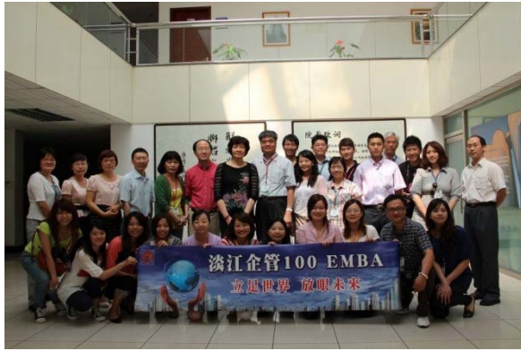
圖 9 商管學院及本系師生於 100 學年度 赴北京中科院學術交流時留影