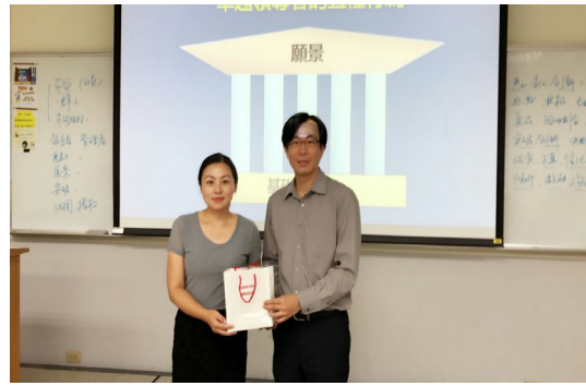
本系於 106 學年度邀請南京航空 航天大學管理系教授蒞校授課