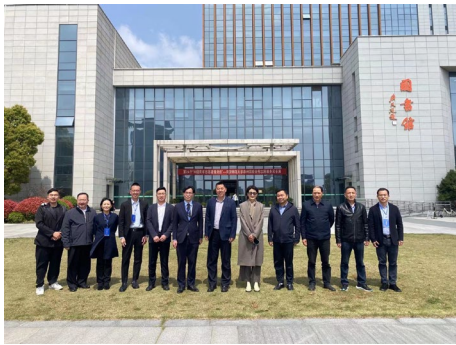
本系教師於 111 學年度赴南京師範大學 泰州學院進行學術交流時合影