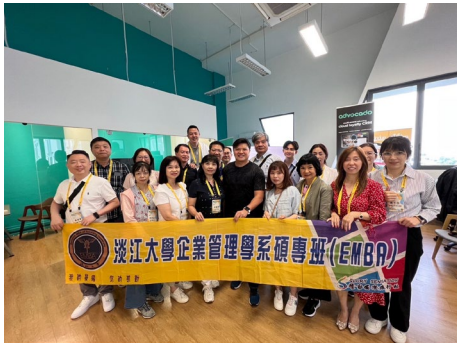
本系師生於 111 學年度赴新加坡境外參訪教學