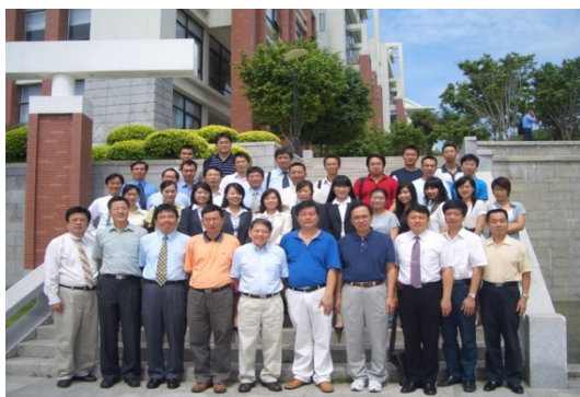
本系師生於 96、95 學年度分赴大陸廈門大學與復旦大學時留影