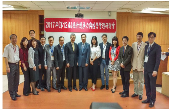
2017 年提升競爭力與經營管理研討會留影