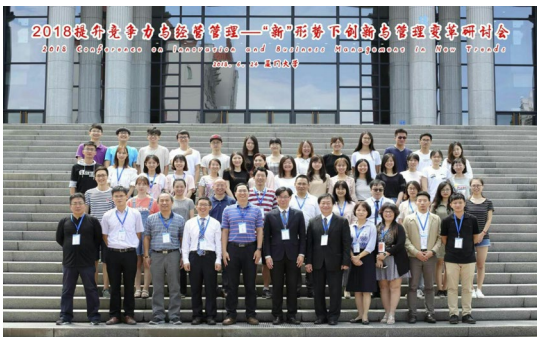
本系教師於 106 學年度赴廈門大學企管系 進行學術交流