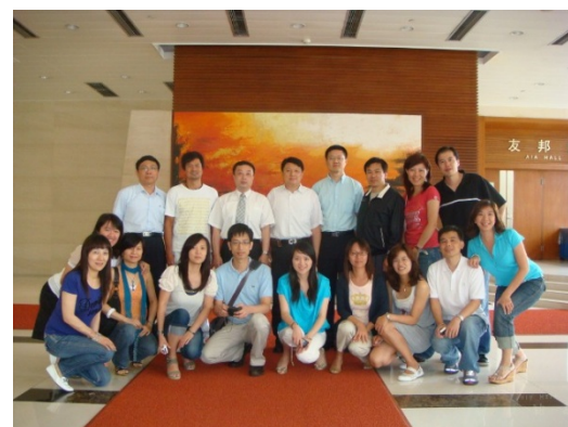
本系於 104-111 學年度 EMBA 歲末聯歡競賽年年獲獎