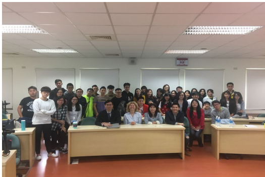
本系於 106 學年度邀請俄羅斯普丁總統顧問 Zaytseva 教授蒞校進行學術交流