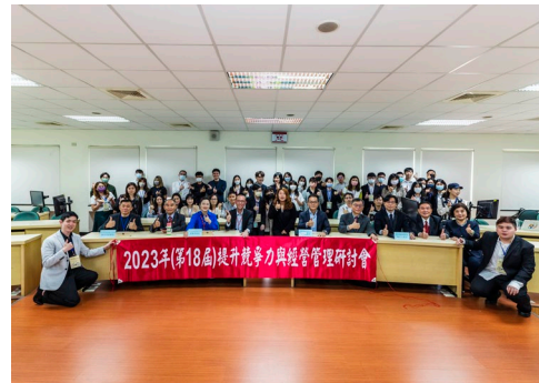
2023 提升競爭力與經營管理研討會留影

除此之外，於 96 學年度商管學院開始了與北京中科院研究生學院之交換學習方案，本系計有 5 位研究生於 2008 年 7 月赴北京學習近 3 週(北京中科院有 13 位研究生於 6 月底來本校學習)；97 學年度北京中科院有 16 位研究生於 6 月底來本校學習，本系因新流感因素並未有學生赴大陸研習；98 學年度本系計有 16 位碩專班研究生於 2010 年 7 月赴北京學習近 3 週(北京中科院有 18 位研究生於 6 月底來本校學習)，99 學年度本系計有 20 位碩專班研究生於 2011 年 6 月赴北京學習(北京中科院有 15 位研究生於 7 月初來本校學習)，100 學年度本系計有 21 位碩專班研究生於 2012 年 7 月初赴北京學習(北京中科院有 12 位研究生於 6 月底來本校學習)，101 學年度本系計有 10 位碩專班研究生於 2013 年 7 月下旬赴重慶大學、武漢大學、中南財經政法大學學習；103 及 104 學年度本系計有 17 及 15 位碩專班研究生於暑期赴蘭州大學及雲林之學術機構學習；105 學年度本系計有 18 位碩專班研究生於暑期赴日本豐田汽車、王子製紙株式會社及當地特色產業參訪；106 學年度本系師生參訪日本企業及千葉商業大學，18 位碩專班研究生於暑期赴日本參訪當地特色產業；107 學年度本系師生前往日本法政大學參訪；108 學年度於 2019 年 7 月赴柬埔寨參訪當地特色產業；因應 COVID-19 疫情，109 學年度於 2020 年 7 月赴金門、澎湖參訪當地特色企業，這也是本系學生更多參與海外學習活動及拓展國際觀的重要里程碑。111 學年度於 2022 年 7 月赴新加坡參訪當地企業，進行經驗及學習交流。