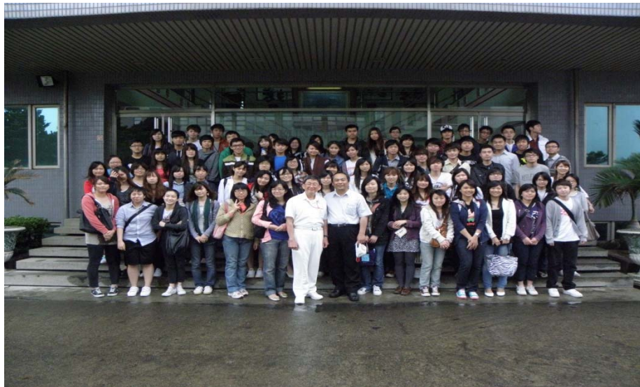
圖 1 本系大學部學生參訪光泉大園廠留影