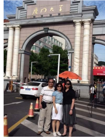
圖 10 本系教師於 100 學年度(2012/7/25) 赴廈門大學企管系學術交流時留影

除此之外，於 96 學年度管理學院開始了與北京中科院研究生學院之交換學習方案，本系計有 5 位研究生於 97 年 7 月赴北京學習近 3 週(北京中科院研有 13 位究生於 6 月底來本校學習)，97 學年度北京中科院有 16 位研究生於 6 月底來本校學習，本系因新流感因素並未有學生赴大陸研習，98 學年度本系計有 16 位碩專班研究生於 99 年 7 月赴北京學習近 3 週(北京中科院有 18 位研究生於 6 月底來本校學習)，99 學年度本系計有 20 位碩專班研究生於 99 年 6 月赴北京學習(北京中科院有 15 位研究生於 7 月初來本校學習)，100 學年度本系計有 21 位碩專班研究生於 2012 年 7 月初赴北京學習(北京中科院有 12 位研究生於 6 月底來本校學習)，101 學年度本系計有 10 位碩專班研究生於 2013 年 7 月下旬赴重慶大學、武漢大學、中南財經政法大學學習，這也是本系學生更多參與海外學習活動及拓展國際觀的重要里程碑。