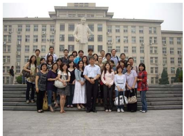
圖 7 2009 年(第六屆)提升競爭力與經營管理研討會