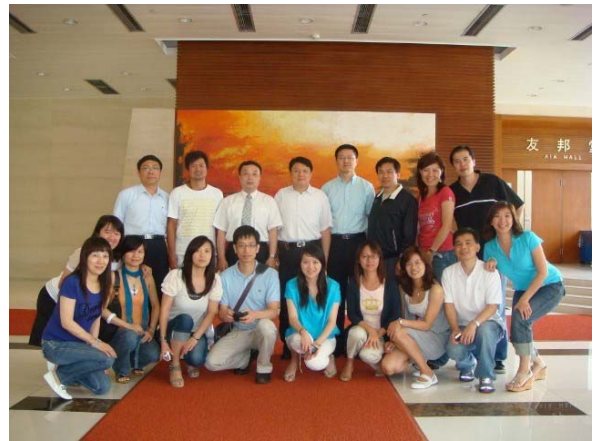
圖 6 本系師生於 97 學年度分赴大陸江西財經大學與復旦大學時留影