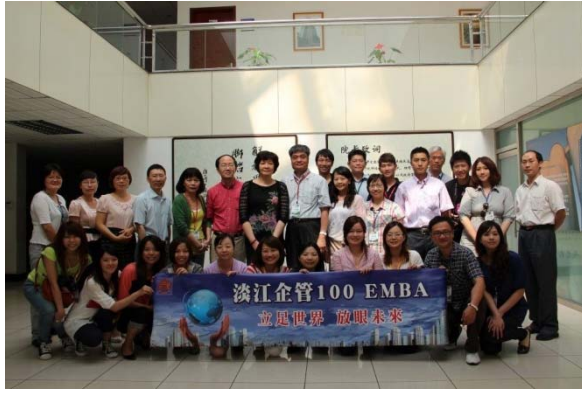
圖 9 商管學院及本系師生於 100 學年度 赴北京中科院學術交流時留影