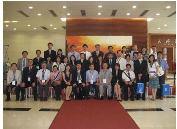
圖 5 本系師生於 96、95 學年度分赴大陸廈門大學與復旦大學時留影