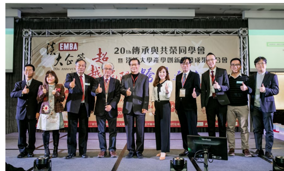
本系於 110 年舉辦第 20 屆傳承與共榮同學會 暨淡江大學產學創新研發成果媒合會