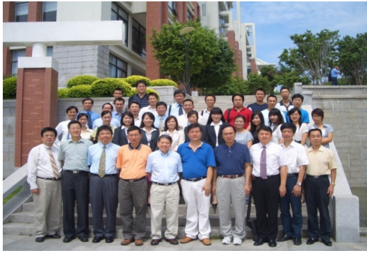
本系師生於 96、95 學年度分赴大陸廈門大學與復旦大學時留影