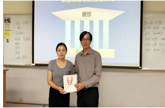
本系於 106 學年度邀請南京航空 航天大學管理系教授蒞校授課