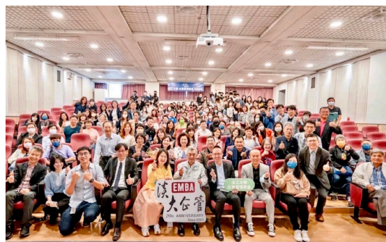
本系於 111 學年度邀請信邦電子王紹新董事長 分享活用經營理念，打造核心競爭力