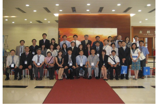
本系師生於 97 學年度分赴大陸江西財經大學與復旦大學時留影