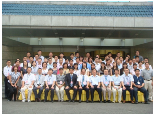
本系師生於 99 學年度赴北京中科院學術交流時於天津南開大學時留影