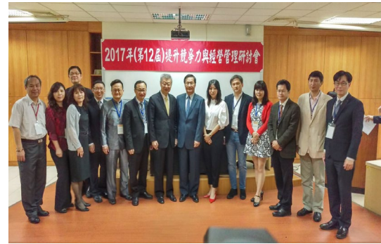
2017 年提升競爭力與經營管理研討會留影