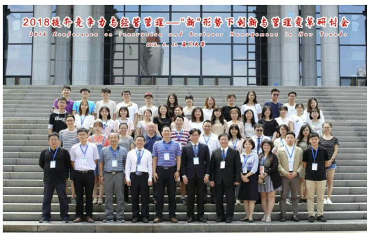
本系教師於 106 學年度赴廈門大學企管系 進行學術交流