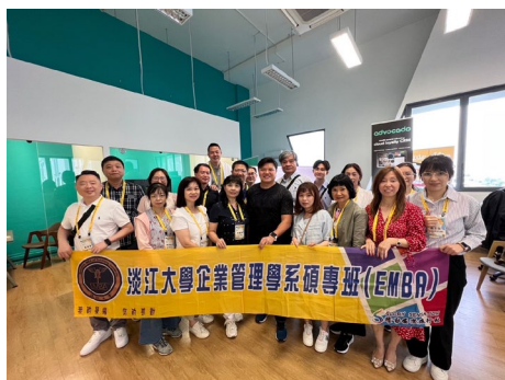
本系師生於 111 學年度赴新加坡境外參訪教學