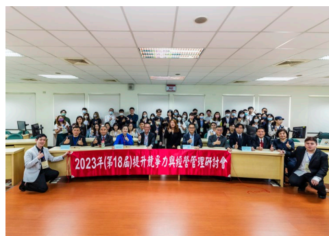
2023 提升競爭力與經營管理研討會留影

除此之外，於 96 學年度商管學院開始了與北京中科院研究生學院之交換學習方案，本系計有 5 位研究生於 2008 年 7 月赴北京學習近 3 週（北京中科院有 13 位研究生於 6 月底來本校學習）；97 學年度北京中科院有 16 位研究生於 6 月底來本校學習，本系因新流感因素並未有學生赴大陸研習；98 學年度本系計有 16 位碩專班研究生於 2010 年 7 月赴北京學習近 3 週（北京中科院有 18 位研究生於 6 月底來本校學習），99 學年度本系計有 20 位碩專班研究生於 2011 年 6 月赴北京學習（北京中科院有 15 位研究生於 7 月初來本校學習），100 學年度本系計有 21 位碩專班研究生於 2012 年 7 月初赴北京學習（北京中科院有 12 位研究生於 6 月底來本校學習），101 學年度本系計有 10 位碩專班研究生於 2013 年 7 月下旬赴重慶大學、武漢大學、中南財經政法大學學習；103 及 104 學年度本系計有 17 及 15 位碩專班研究生於暑期赴蘭州大學及雲林之學術機構學習；105 學年度本系計有 18 位碩專班研究生於暑期赴日本豐田汽車、王子製紙株式會社及當地特色產業參訪；106 學年度本系師生參訪日本企業及千葉商業大學，18 位碩專班研究生於暑期赴日本參訪當地特色產業；107 學年度本系師生前往日本法政大學參訪；108 學年度於 2019 年 7 月赴柬埔寨參訪當地特色產業；因應 COVID-19 疫情，109 學年度於 2020 年 7 月赴金門、澎湖參訪當地特色企業，這也是本系學生更多參與海外學習活動及拓展國際觀的重要里程碑。111 學年度於 2022 年 7 月赴新加坡參訪當地企業，進行經驗及學習交流。