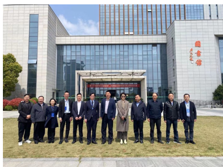
本系教師於 111 學年度赴南京師範大學 泰州學院進行學術交流時合影